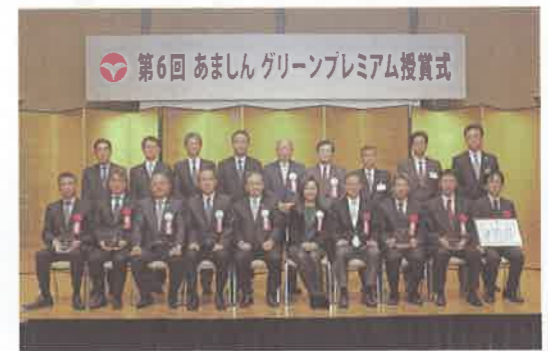
授賞式に臨まれた皆さま