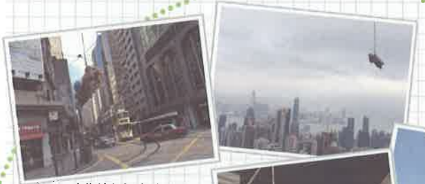
市街地からピクトリア ピークへひとっ飛び！