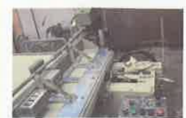
実際は機械で縫います。