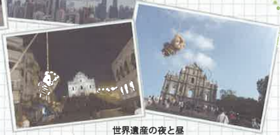
世界遺産の夜と屋 (セントポール天主堂跡)