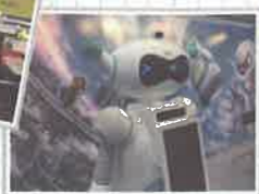
ロボットにウイングされた！

インドネシア、ジョグジャカルタにあるタマンサリというところ。美しい庭園という意味であり、水の宮殿として知られているそうです。