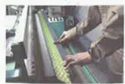
こちらも実際は機械で縫います。